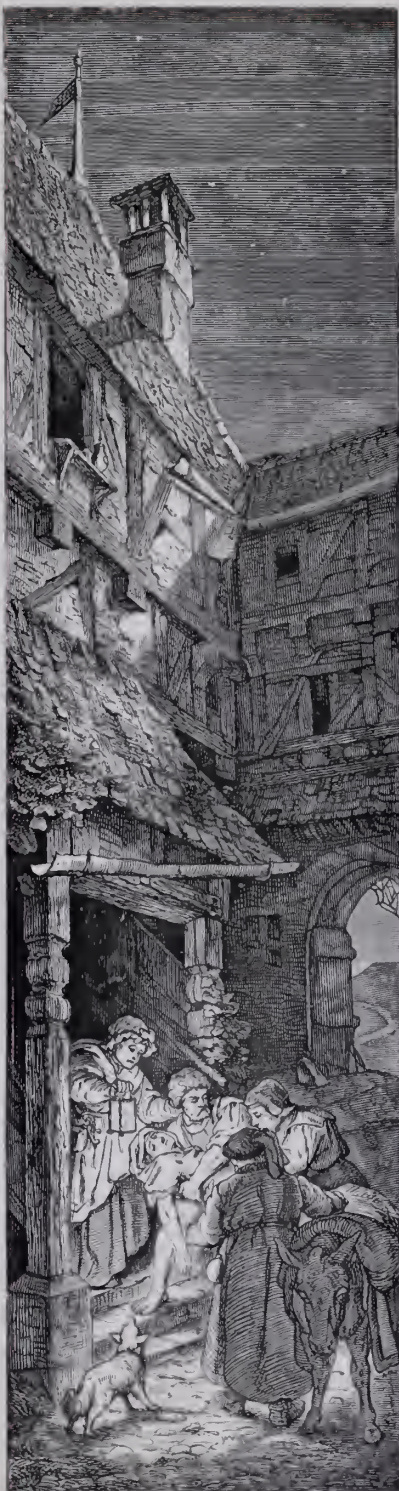
Der barmherzige Samariter.

In der Geißblatt umdämmerten Laube des heimatlichen Gartens — er wurde in Sorau am 2. Februar 1846 geboren —, geleitet von der zarten Sorge hingebender Mutterliebe, da ging dem empfänglichen Knaben das Ahnen heiliger Bilder in sonnig frohen Tagen auf. Berlin, wohin sein Vater später als Regimentsarzt versetzt wurde, erschloß ihm eine neue bewegte Welt. Bald aber ward ihm der Tod ein Lehrer von Weh und Not: dem 9 jährigen Knaben starb der Vater. Und auf dem weiten Schulwege drang auch das große Klaglied der Elenden, das tief in Kellern stöhnt, oft an sein Ohr. Ein Glück nur, daß in dieser entbehrungsreichen, trüben Zeit des Werdens die Großstadt noch nicht die Herzen beengte. Noch lachten rings sonnige Felder, und blauender Himmel lag über düsteren Föhren, die tief und geheimnisvoll raunten. Im Nachglühen der sinkenden Sonne, im Zuge der Sehnsucht weckenden Wolken träumte er sich mit halb-bewußter Seele hinein in die Stille und legte unbewußt den Grund zu der religiösen Stimmung seines Gemüts, der durch die schlichte Frömmigkeit seiner Mutter wie durch den Einfluß seines weitaus älteren Bruders